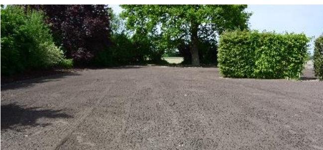
1. Schritt: Vorbereitung der Fläche, Boden planieren.