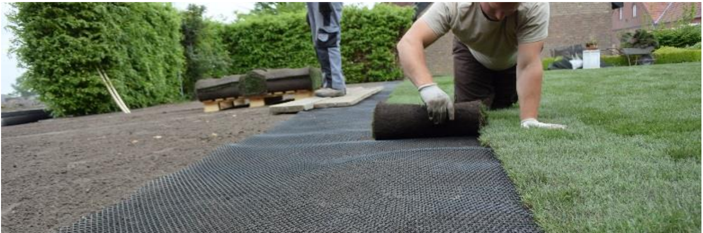
Verlegung von Rollrasen auf der TALPATEC Premium Maulwurfsperrbahn