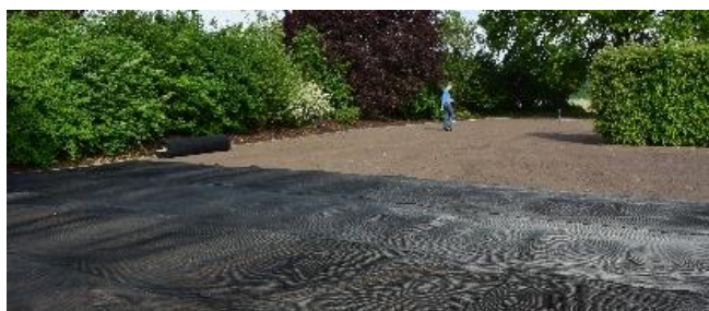
2. Schritt: Auslegung der Maulwurfsperrbahn. Bahnen 15 - 20 cm überlappend legen. Wir empfehlen zusätzlich den Gebrauch von Erdankern ca. alle 50 cm.

3. Schritt: Auf der Maulwurfsperrbahn eine Wurzelschicht von ca. 3 - 5 cm Mutterboden aufschütten, um Schäden am Gitter durch Vertikutierarbeiten zu vermeiden. Bei der Aufschüttung das Gitter nicht beschädigen oder verschieben. Darauf Rollrasen wie gewohnt verlegen und wässern. Bei einer Neueinsaat von Rasen das Saatgut gleichmäßig verteilen und evtl. gegen Vogelfraß mit einer losen Torfschicht schützen und wässern.